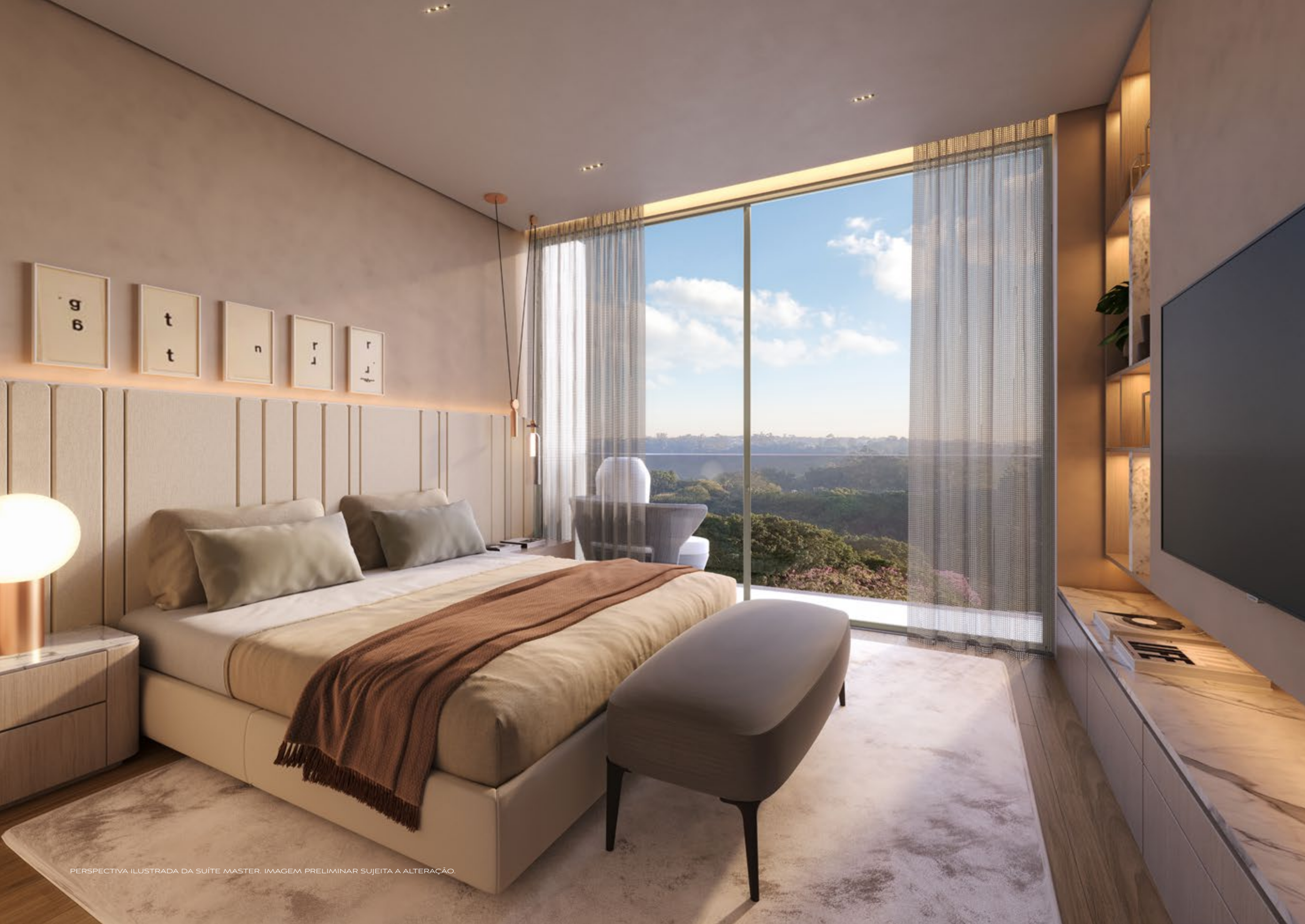
PERSPECTIVA ILUSTRADA DA SUÍTE MASTER. IMAGEM PRELIMINAR SUJEITA A ALTERAÇÃO.