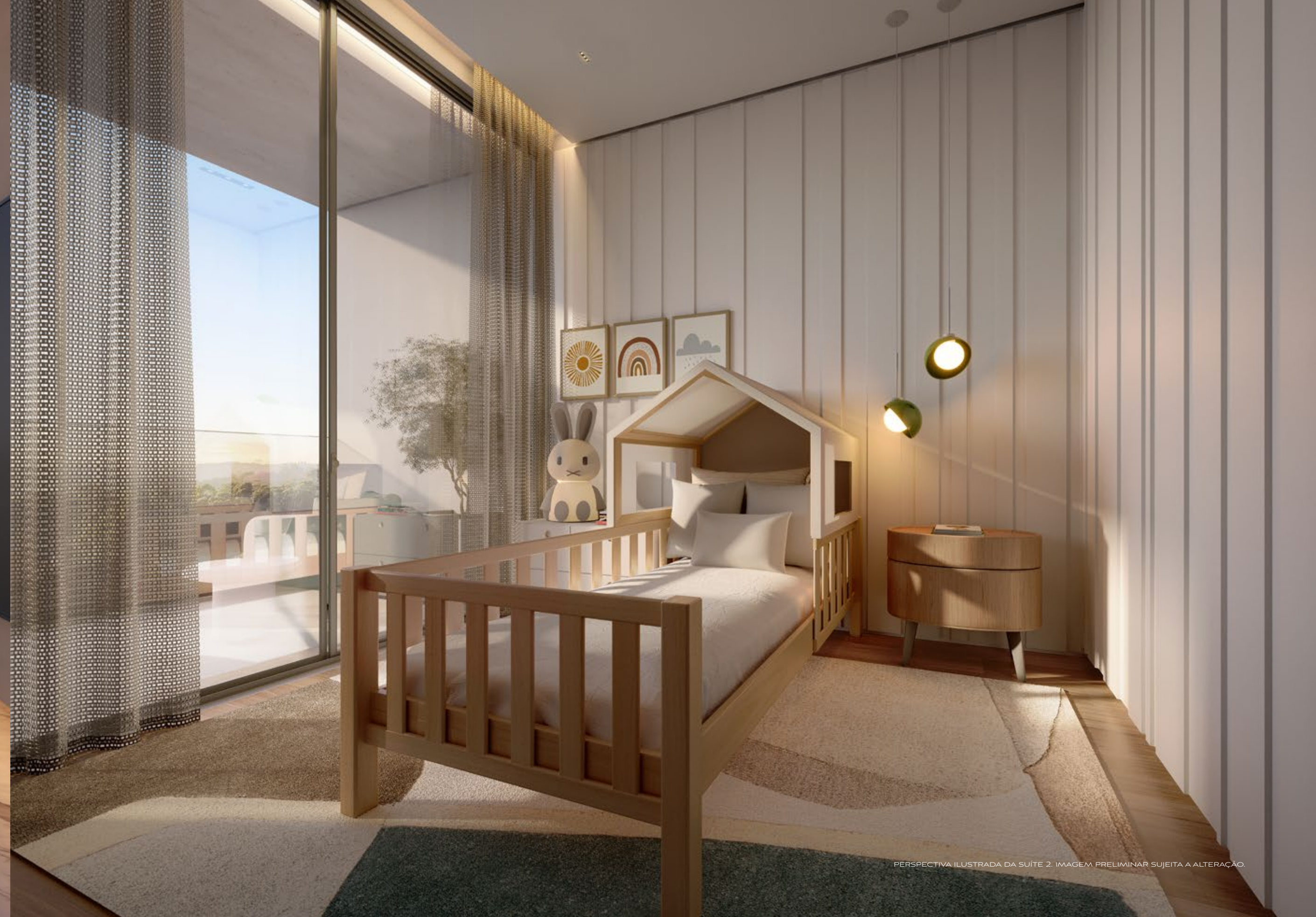
PERSPECTIVA ILUSTRADA DA SUÍTE 2. IMAGEM PRELIMINAR SUJEITA A ALTERAÇÃO.