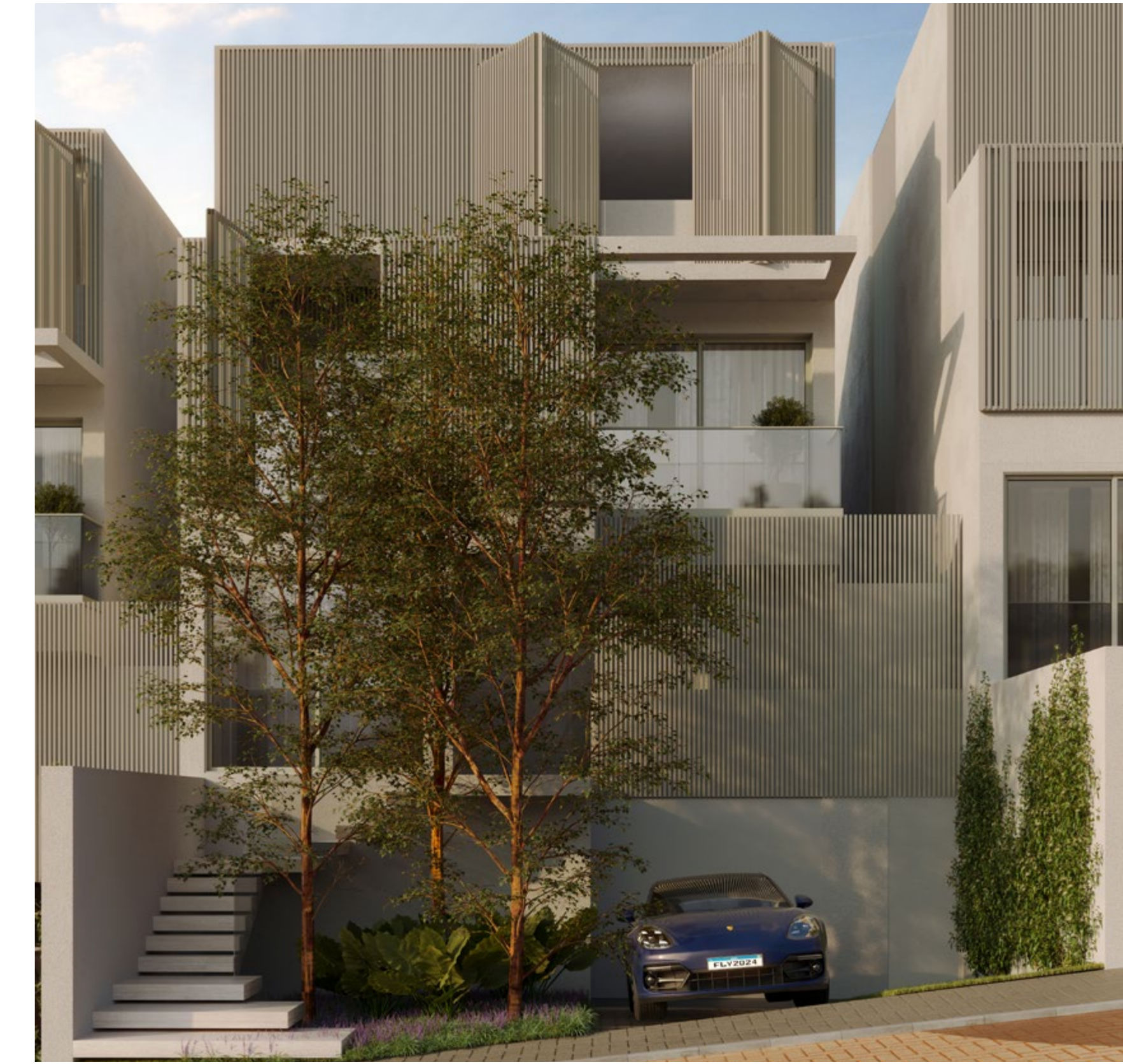
PERSPECTIVA ILUSTRADA DA FACHADA. IMAGEM PRELIMINAR SUJEITA A ALTERAÇÃO.