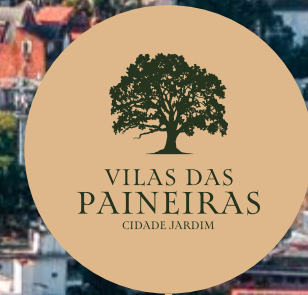
FOTO AÉREA DA REGIÃO.