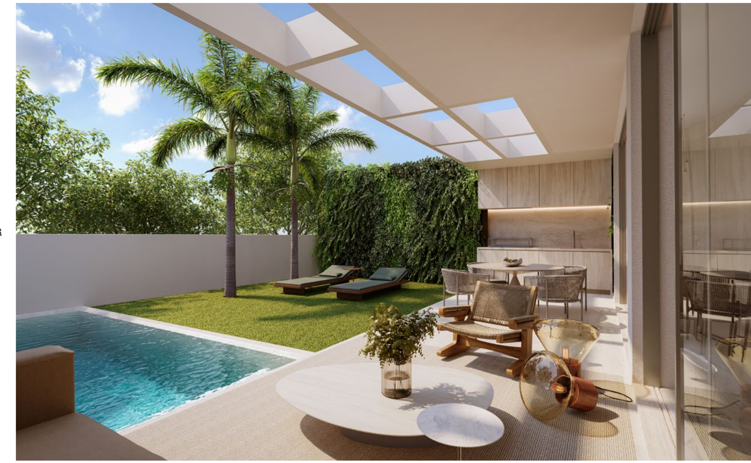
PERSPECTIVA ILUSTRADA DO JARDIM E PISCINA. IMAGEM PRELIMINAR SUJEITA A ALTERAÇÃO.